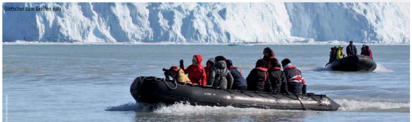
Gletscher zum Greifen nah

Bei der individuellen Rückreise von Island: Bitte stimmen Sie die Flugzeiten mit der Ankunft des Charterflugs ab.